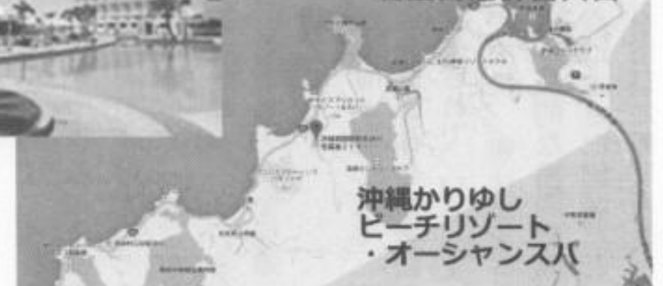
沖縄かりゆし ビーチリゾート ・オーシャンスパ