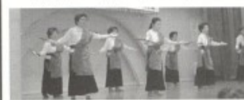
衣装も鮮やかな民舞サークル

からの総会参加者には、交通費を出してほしい」という意見が出されました。「総会への代表参加を指示している宮古・八重山両ブロックの会員には、航空運賃や宿泊費を支払っていただきますが、本島内のどの地域から参加しても交通費は支払っていない。」他の地域からの参加者への波及や予算の問題も含めて改めて新しい幹事会で検討することと