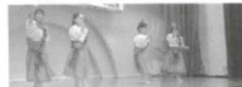
赤いスカートがよく似合うフラガール