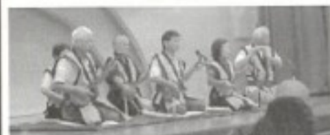
幕開け・三線サークルの皆さん