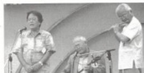
とうばらーま熱唱・八重山トリオ

今後、交流会では八重山の「とうばらーま」と宮古の「なりやまあやく」をプログラムに毎年、組み込み