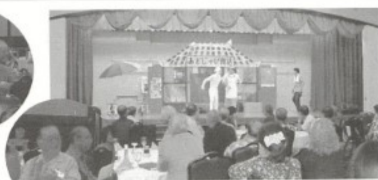
ほんとにアギジャビヨーでした