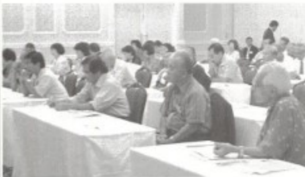
80余名の総会参加者

また、昨日は連合沖縄の定期大会で「辺野古への新基地建設と県内移設に反対」することを決定しています。十一月八日の県民大会へは多数の会員の参加を呼びかけます。