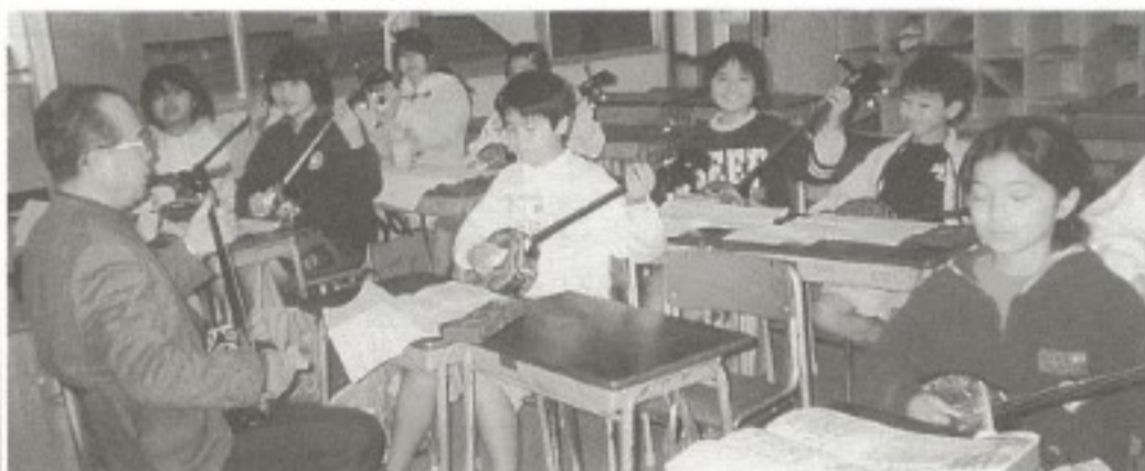
▲同南小学校の三線クラブ