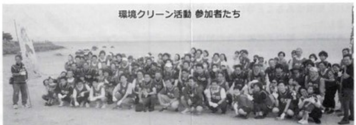
環境クリーン活動 参加者たち