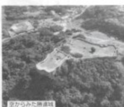
空からみた勝連城