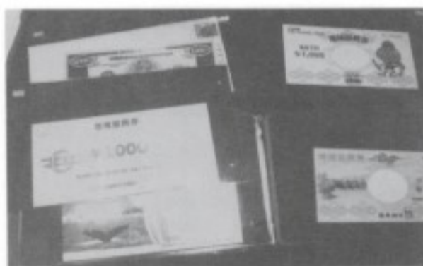
18年前に発行された地域振興券 沖縄の全市町村のがある