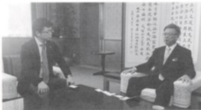
翁長知事と意見交換する石橋議員

もちろん、今、最大の課題は、安保法案の成立阻止です。日本が再び戦争をする国になれば、有事の際に狙われるのは米軍基地であり、沖縄です。時の権力者の判断で、自衛隊が歯止めなく海外展開し、武力行使できてしまう、しかも後方支援と称して、核兵器や化学兵器まで輸送できてしまふ、そんな違憲法案、断固、