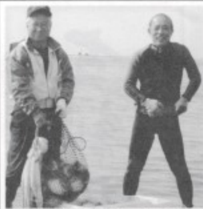
浦添港子定地牧港(カーミー)にて

海でよく遊んだ幼少の頃の事を定年後やってみようと、海人になる諸種の条件をクリアし、いま海人をやっています。那覇市沿岸漁業協同組合の正組合員です。シーカヤックと小型漁船をあやつり素もぐり漁中心。漁業区域は瀬長島から北谷までとチービシ海域。私は主に浦添市西海岸の牧港沖を漁場とし、夏は昼間、冬は夜間LEDライトを使用してもぐっています。夏のタコは小ぶり、冬になると大きく海水の暖かい浅瀬に寄ってきます。漁へ出る日は天候・気象を確認し、干潮時間の三〜四時間前あたり海へ下り、潮の流れに乗って泳ぎ、狙いはタコ穴を見つけることから始まる。