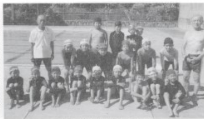
翔南小学校での水泳教室にて

人間の住居に名札があるように、タコも「ここが自分の住居(穴)ですよ」と石印あり。穴にそーっとモリを入れると「誰だ！住居に勝手に侵入するな」と水鉄砲のごとく海水を吹き出し、砂煙をまきあげ威嚇してくる。このやりとりが面白い。もう一本のモリを入れるとヨロイ代りに押し出し、引っぱったり「これはやばい」と危険を察すると、穴から外をうかがいながら出てきて、サツと墨を吐いて逃げ出す。穴から出た瞬間がチャンス。小さいのは手づかみでも大丈夫ですが、三キロ以上の大物になると体に巻きつき人の体形を知っているかの如く背中にもわる。吸引力強く力負けし、手を離すと墨を吐いて逃げる。だが墨の真下にかくれる習性あり。タコも人間社会と同じで夫婦で生活し、メスは穴の中でオスは入口に座し見張り(っ)をしています。オスが近くに群がっていることが多い。吸盤は二列(南極のタコは一列でした)メスは同じ大きさで揃っていますが、