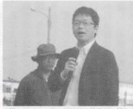
辺野古のゲート前で新基地建設反対を訴える

民主党の方針転換すら実現出来ておらず、忸怩たる思いです。沖縄の先輩方に申し訳なく思っています。