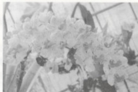
さわやかな甘い香りのランたち

2003年4月春の沖縄県洋蘭展示会において初めて銀賞(沖縄県市町村長賞)を獲得して以来毎年春、秋の展示会で入賞するまでになり、少しは趣味が生きてきたかなと思います。展示会に入賞すると多くの知人や友人の輪が広がり祝福を受け、自分ながら満足しています。